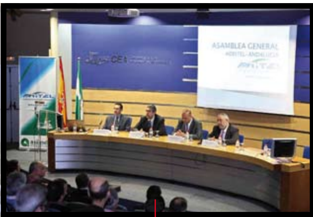
Imágenes de la pasada Asamblea General de FAITEL.